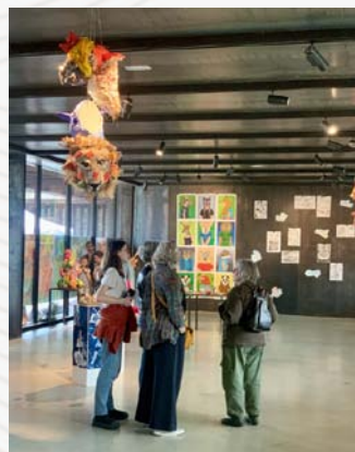
Exposition arts plastiques L'Atelier 🎨